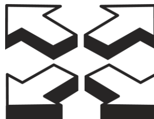
Iżola ruġek mill-familja u mill-ħbieb tiegħek