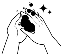
Savata na ligamu ka tabonaka na vuvu kei na suru