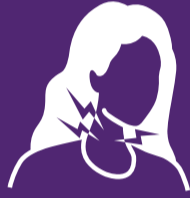
د ستونی درد