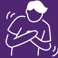
لرزه یا خولې