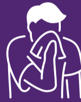
د پوزې بهیدل